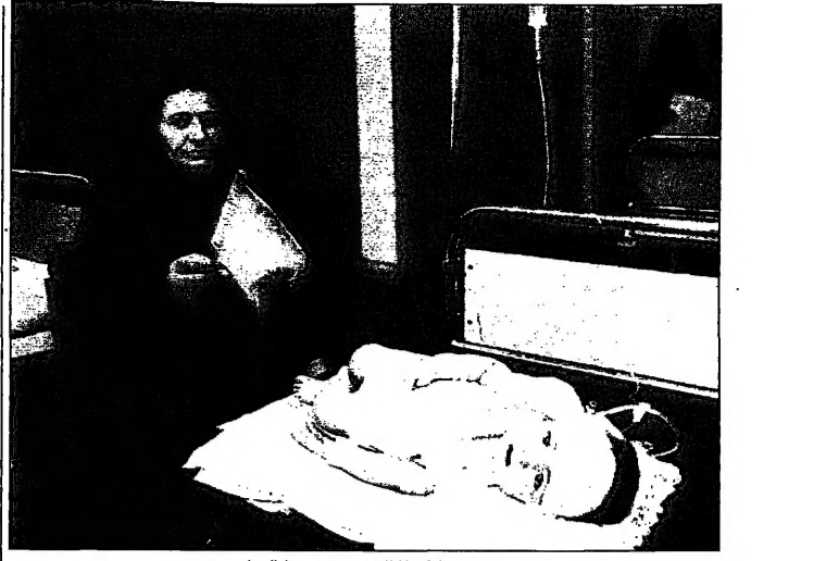
سيد عرافية مع مطلقا للوزير في مستشاره بديعار (أدب)